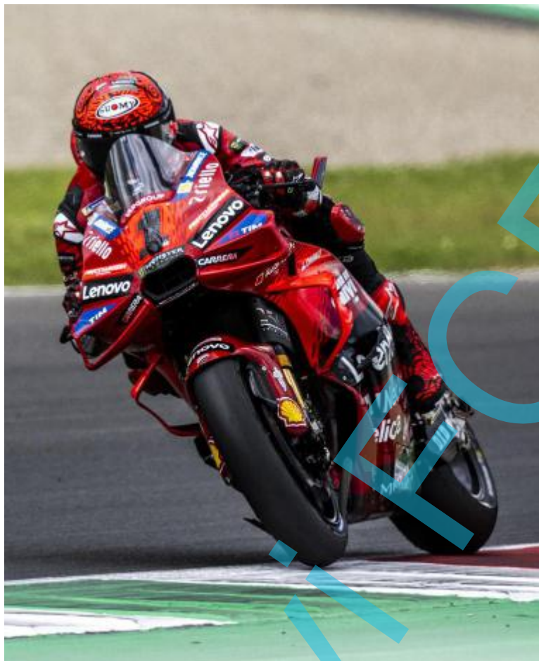
Pecco Bagnaia è stato il più veloce nelle prove del venerdì

«Io in tilt per il futuro? Assolutamente no, il mio passo gara parla da sé»